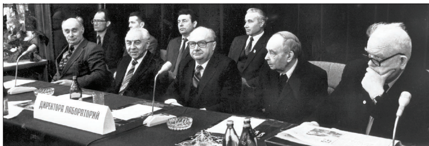
80-е годы. Директора лабораторий на сессии Ученого совета.