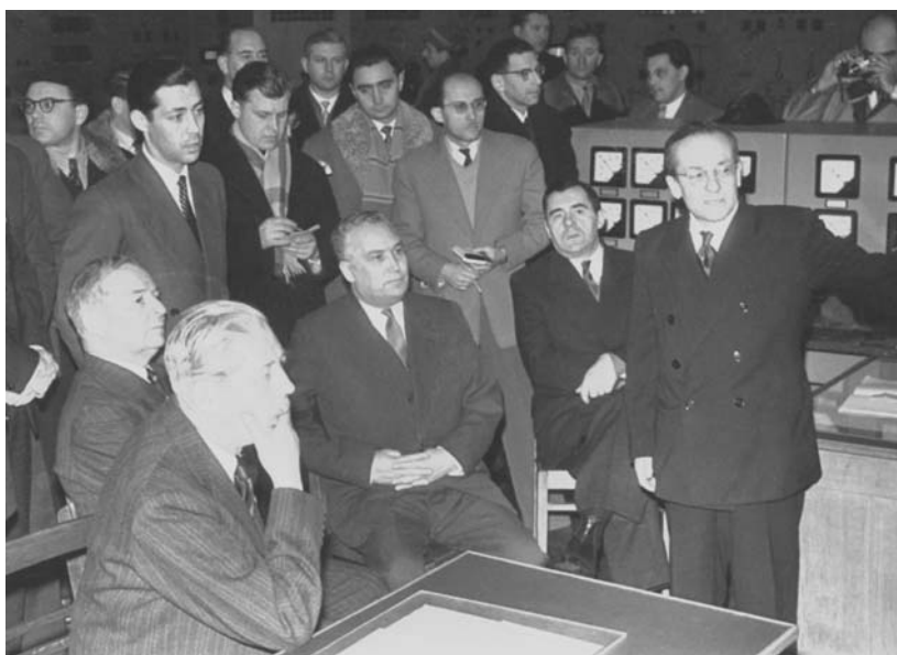
Премьер-министр Великобритании Г. Макмиллан в ОИЯИ. В первом ряду (слева направо): Э. Иден, Г. Макмиллан, Ф. Ф. Козлов, А. А. Громыко, В. И. Векслер. 1959 г.