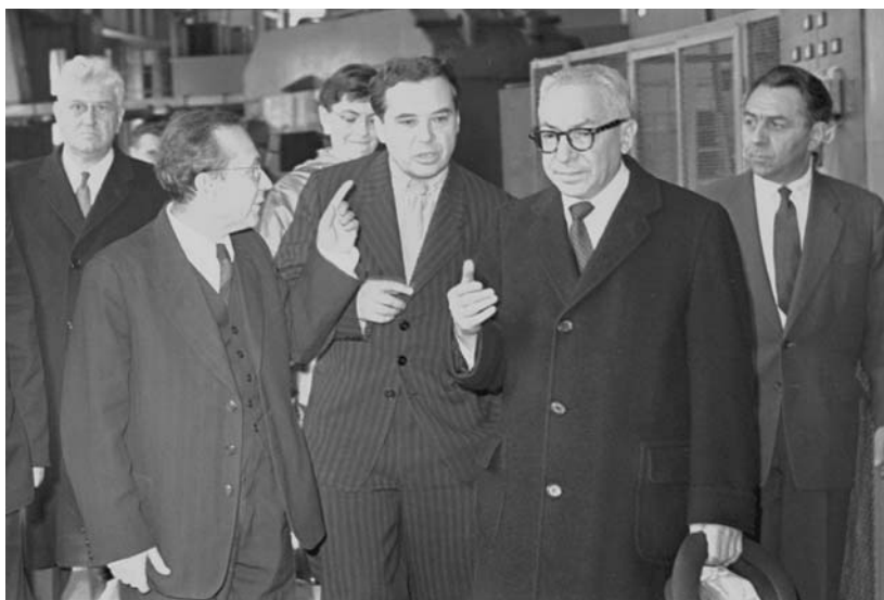
Председатель Комиссии по атомной энергии США И. Раби во время посещения ОИЯИ. Слева направо: В. С. Емельянов, В. И. Векслер, Д. Д. Иваненко, И. Раби, В. П. Джелепов. 1959 г.