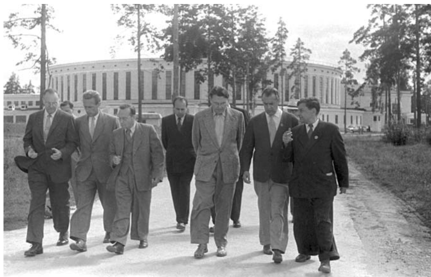
Американские ученые и сенаторы в ОИЯИ. Лаборатория высоких энергий, 1957 г.