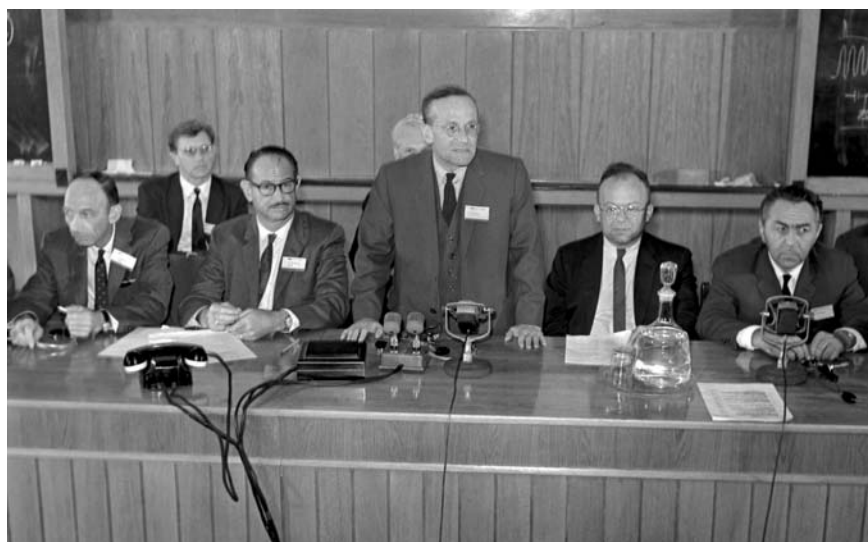
Президиум Международной конференции по ускорителям. Слева направо: Дж. К. Грин (США), Э. Макмиллан (США), В. И. Векслер, В. Пановский (США), В. П. Джелепов. 1963 г.