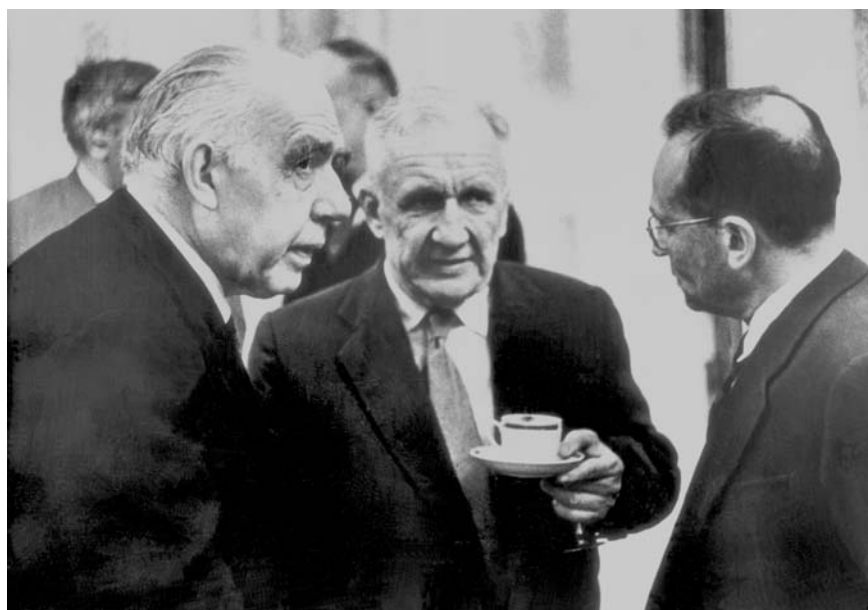
Нильс Бор, И. Е. Тамм, В. И. Векслер. 1961 г.