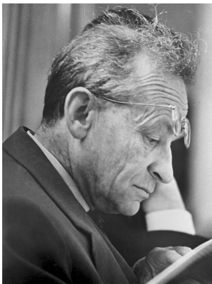
Академик В. И. Векслер