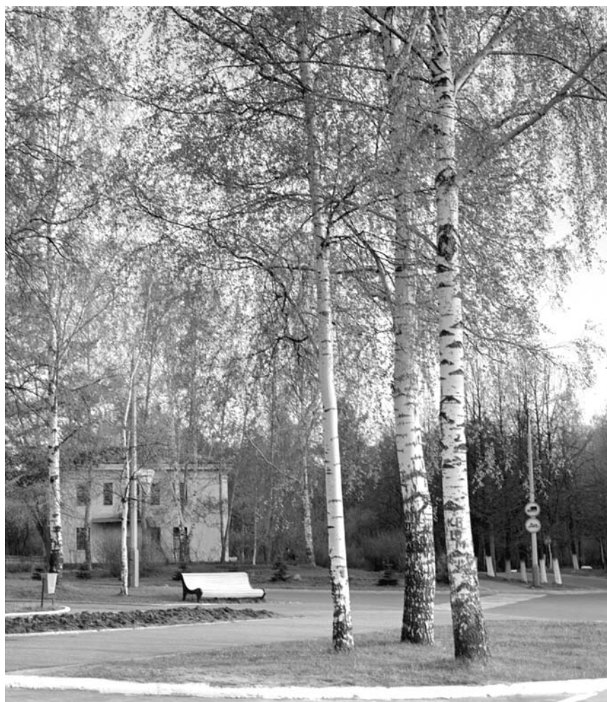
Улица имени академика В. И. Векслера в городе Дубне