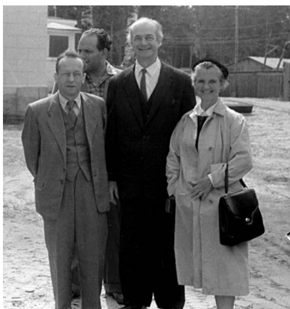
В. И. Векслер с лауреатом Нобелевской премии Л. Полингом и его супругой перед зданием синхрофазотрона. 1959 г.