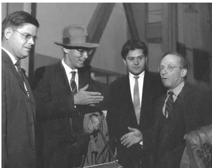
Американская делегация во главе с Р. Маршаком. Слева направо: Р. Вильсон, Р. Маршак, ..., В. И. Векслер. 1960 г.