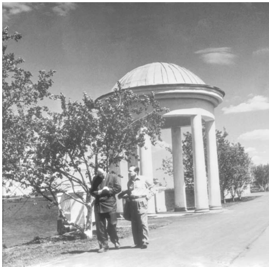
В. И. Векслер (справа) и И. М. Франк на набережной Волги. Дубна, 1960 г.