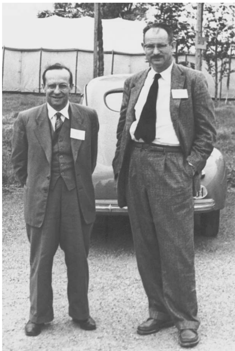
В. И. Векслер и Э. Макмиллан. Дубна, 1963 г.