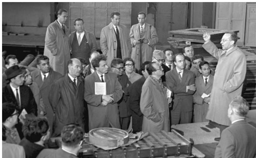
Посещение Лаборатории высоких энергий советскими и иностранными журналистами. 1962 г.