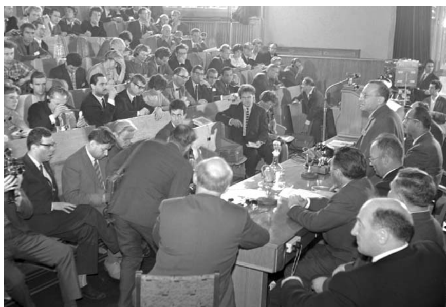
Пресс-конференция, посвященная открытию Международной конференции по ускорителям. На вопросы журналистов отвечает В. И. Векслер. 1963 г.