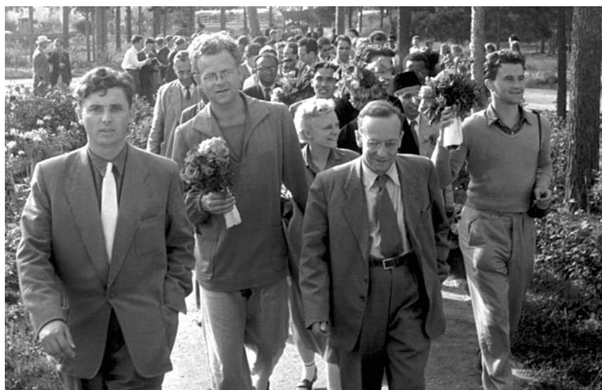
В. И. Векслер среди участников VI Всемирного фестиваля молодежи, посетивших Дубну. 1956 г.