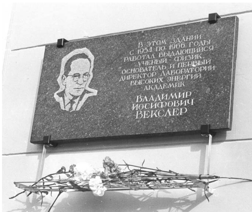
Мемориальная доска, посвященная академику В. И. Векслеру, на здании Лаборатории высоких энергий ОИЯИ